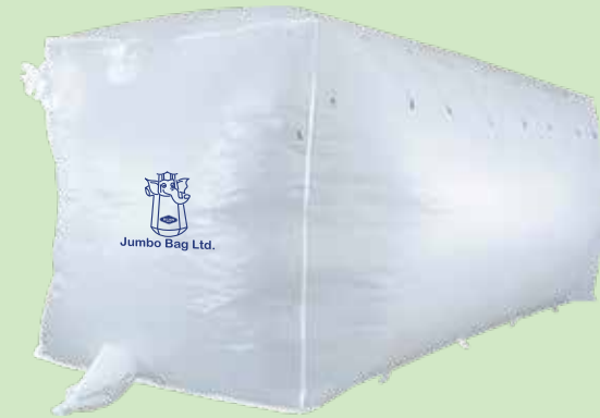
CONTAINER LINER BAG