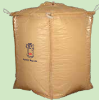
ROPE LIFTING BAG