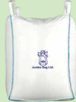
PALLET FREE BAGS JUMBO ECO PALLET