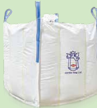
BAFFLE BAG JUMBO CUBE