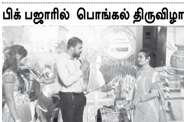
சென்னை, ஜன. 14 - சென்னையில் பிரபலமாக விளங்கும் பிக் பஜார் சூப்பர் மார்க்கெட் கடைகளில் உள்ள வாடிக்கையாளர்களை மகிழ்விக்கும் வகையில் பிக் பஜார் பொங்கல் திருவிழா வெகு விமரிசையாக சென்னை வடபுற பிக் பஜார் வளாகத்தில் நடைபெற்றது. இதில் பெண்களை கவரும் வகையில் கோலப் போட்டி, பொங்கல் வைத்தல் போன்ற நிகழ்ச்சிகளும், ஒயிலாட்டம், மயிலாட்டம், தப்பாட்டம் போன்ற கலை நிகழ்ச்சிகளும் நடைபெற்றது. வாடிக்கையாளர்களை கவரும் வகையில் உறியடி திருவிழா மற்றும் ஓலைக் குடிசையில் வீடு கட்டி அங்கு பல்வேறு கலை நிகழ்ச்சிகள் நடத்தப்பட்டன. இதில் பங்குபெற்ற அனைத்து வாடிக்கையாளர்களுக்கும் பிக் பஜாரின் பொங்கல் பரிசு வழங்கப்பட்டது. ஆண்டுதோறும் நடைபெறும் இந்த திருவிழாவில் வாடிக்கையாளர்கள் மிகவும் ஆர்வத்துடன் பங்கு பெற்று மகிழ்ந்தனர்.