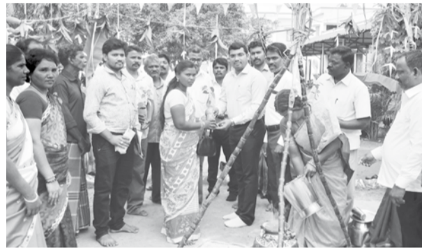
பயிற்சி மையம் நடைபெற்று வருகின்றது. இம்மையத்தில் பொங்கல் திருநாளை முன்னிட்டு புகழ்மொழி விழா மற்றும் பெற்றோர் கூட்டம் நடைபெற்றது.

காஞ்சிபுரம், ஜன. 14 - காஞ்சிபுரம் அடுத்தள்ள சிறுகாவேரிபாக்கம் ஊராட்சியில் அனைவருக்கும் கல்வி இயக்கம் மற்றும் ஹேண்ட் இன் ஹேண்ட் இந்தியா குழுவைத் தொழிலாளர் முறை அகற்றும் திட்டத்தின் சார்பில் பள்ளி செல்லா, பள்ளி இடைநின்ற மற்றும் குழந்தை தொழிலாளர் முறையிலிருந்து விடுவிக்கப்பட்ட குழந்தைகளுக்காக பூங்காவனம் உண்டு உறைவிட சிறப்பு