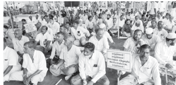
புதுச்சேரி, அக். 26-

புதுச்சேரி அடுத்த கோட்டக்குப்பம் பகுதிகளில் 10 ஆண்டுகளுக்கு மேலாக ஏற்படும் தொடர் மின்வெட்டு பிரச்சனைக்கு நிரந்தர தீர்வு காண, பொதுமக்கள் அவ்வப்போது போராட்டத்தில் ஈடுபட்டு வருகின்றனர். கடந்த சில மாதங்களாக ஏற்படும் மின்வெட்டு மற்றும் குறைந்த அழுத்த மின்சாரம் காரணமாக கோட்டக்குப்பம் பகுதிகளில் உள்ள வீடு, வணிக நிறுவனங்களில் மின்சாரதள பொருட்கள் அடிக்கடி பழுதாகி பொருளாதார இழப்பையும் ஏற்படுத்தி வருகிறது.