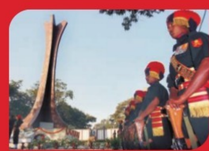
PUNE WAR MEMORIAL Inaugurated in 1998, this memorial was constructed as a mark of respect to the martyrs who laid down their lives post World War II.

We at The Express Group believe that while it's almost impossible to soothe a grieving heart, we can do something to ease the pain. The Express Citizens' Relief Fund is one such initiative. It makes financial assistance from The Express Group and compassionate readers like you, reach those going through a tough time. Your unwavering belief in us has helped us actively undertake and complete various projects.