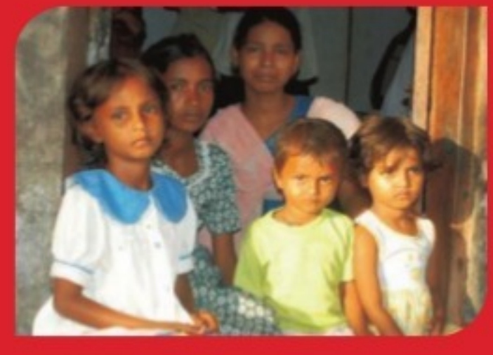
MUMBAI BLAST VICTIMS RELIEF FUND All the money collected under this scheme has been used to open an FD account in the name of the five children of the Yadav family, who lost their parents in the Mumbai blast at the Gateway of India in 2003. They will have access to these funds when they turn adults.