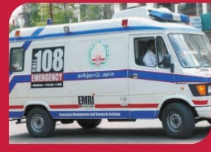
TSUNAMI RELIEF FUND With the funds collected, an ambulance service was started in Chennai in February 2011.