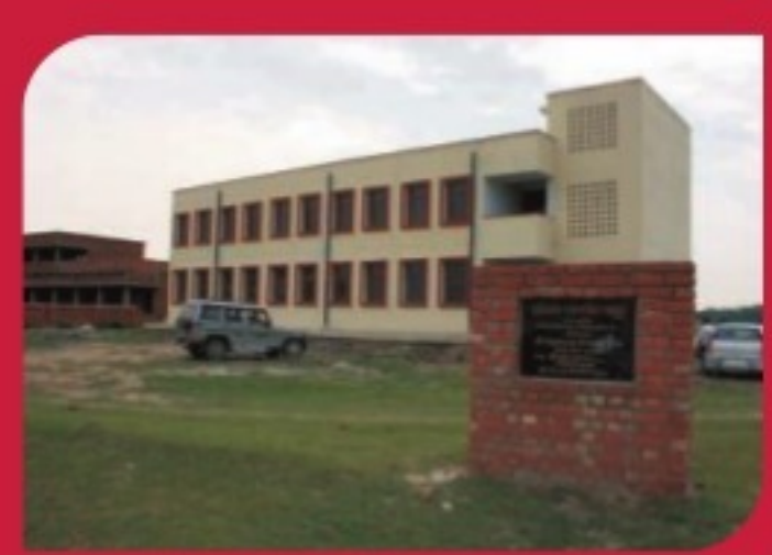
BIHAR FLOOD RELIEF FUND The funds have been used to build a multi-utility block in a Government School in village Lagma, district Saharsa. Inaugurated in May 2011, The Express Block functions as a school-cum-flood relief centre for villagers.